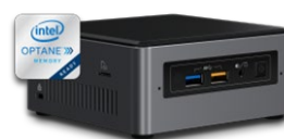
Server med Analyse Software