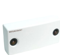
3D Sensor Kamera