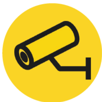
Identify & Verify

Der kan foretages faste runderinger på forhåndsbestemte tidspunkter, eller vilkårlige runderinger, helt efter kundens ønsker og behov. Løsningen udnytter den moderne teknologi og kan levere kosteffektiv område- og lokationssikring, uden faste og ressourcekrævende fysiske vagter. I stedet vil vores videooperatører kun rekvirere en fysisk vagt, eller kundens egen kontaktperson, hvis der observeres uønskede eller uautoriserede aktiviteter på kundens område.